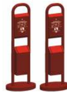
Hundetoilette rot 2 Stück 70292 | 1:87 | 5,50 €