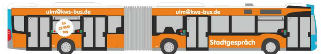
MERCEDES-BENZ Citaro G `12 „SWU, Ulm“ 69552 | 1:87 | D | 35,90 €