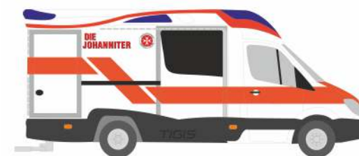
AMBULANZ MOBILE Tigus Ergo „Die Johanniter Dortmund“ 68627 | 1:87 | D | 24,90 €