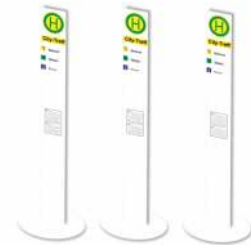
Haltestellenschild, modern 3 Stück 70293 | 1:87 | 5,50 €