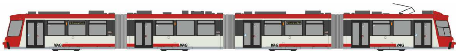
ADTRANZ GT8 „VAG, Nürnberg - Wagen 1126“ STRA01024 | 1:87 | D | 149,90 €