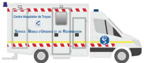
WIETMARSCHER AMBULANZF. RTW „SAMU“ 61799 | 1:87 | FR | 20,90 €