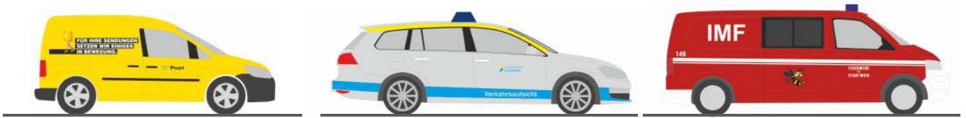
VOLKSWAGEN Caddy `11 „Post.at“ 31807 | 1:87 | AT | 14,90 €