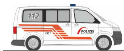
VOLKSWAGEN T5 „Polizei Baselland“ 51885 | 1:87 | CH | 14,90 €