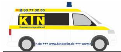
VOLKSWAGEN T5 GP „KTN Krankentransporte Nord UG, Berlin“ 53612 | 1:87 | D | 16,90 €