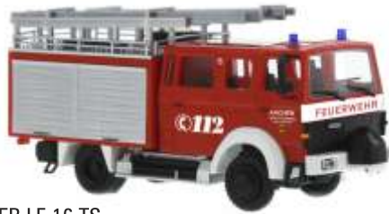
LENTNER LF 16-TS „Feuerwehr Aachen“ 71214 | 1:87 | D | PG 43