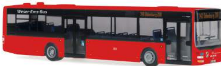
MAN Lion's City