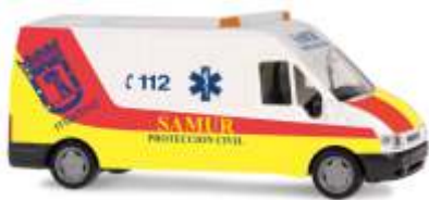
FORD Transit 2000 „Proteccion Civil Samur“ 51062 | 1:87 | ES | PG 19