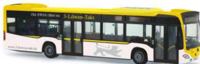
MERCEDES-BENZ Citaro '12