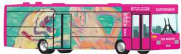
MERCEDES-BENZ O 405 „Essl Museum“ 71823 | 1:87 | AT | PG 45