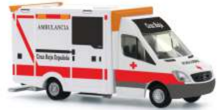
WIETMARSCHER AMBULANZF. Design-RTW „Cruz Roja Espanola“ 72019 | 1:87 | ES | PG 28