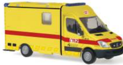
STROBEL RTW „Ambulance“ 61795 | 1:87 | B | PG 28