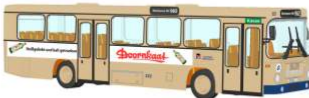
MAN SL 200 „Stoag - Doornkaat“ 72314 | 1:87 | D | PG 49