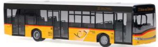
SOLARIS Urbino 12 „Die Post, Untervaz/GR“ 65961 | 1:87 | CH | PG 45