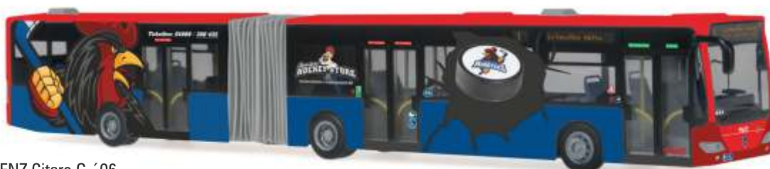
MERCEDES-BENZ Citaro G 06 „MVG - Iserlohn Roosters“ 67078 | 1:87 | D | PG 49