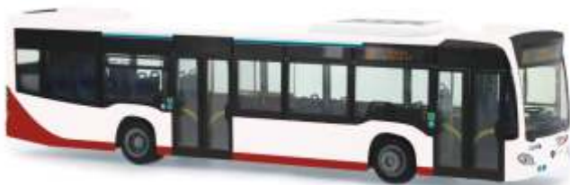
MERCEDES-BENZ Citaro 12 „Verkehrsgesellschaft Oberhessen“ 69453 | 1:87 | D | PG 45