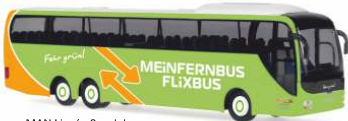
MAN Lion's Coach L „MeinFernbus.de - Rheingold Reisen“ 64393 | 1:87 | D | PG 45