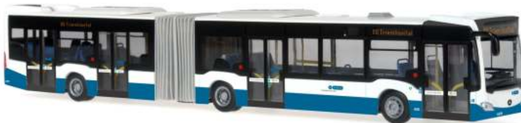
MERCEDES-BENZ Citaro G '12 „VBZ Zürich“