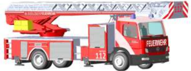
MAGIRUS Atego DLK 32 „Feuerwehr Berlin“ 71602 | 1:87 | D | PG 45