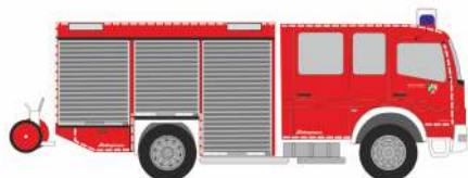
SCHLINGMANN HLF 20/16 „Institut der Feuerwehr NRW“ 68272 | 1:87 | D | 26,90 €