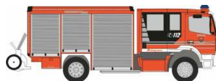
SCHLINGMANN Varus HLF 20 „FW Itzehoe“ - Formneuheit 72904 | 1:87 | D | 27,90 €