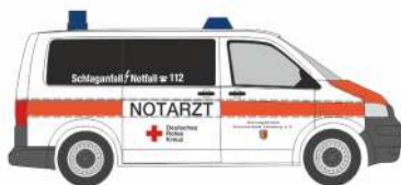
VOLKSWAGEN T5 „Notarzt DRK Lüneburg“ 51923 | 1:87 | D | 16,90 €