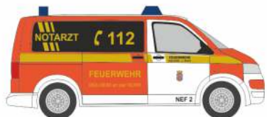
VOLKSWAGEN T5 `10 „Notarzt FW Mülheim/Ruhr“ 53445 | 1:87 | D | 16,90 €