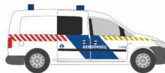
VOLKSWAGEN Caddy Maxi `11 „Rendörseg“ 52711 | 1:87 | HU | 16,90 €