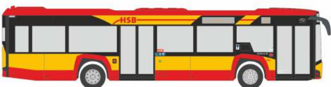
SOLARIS Urbino 12 `19 „Hanauer Straßenbahn“ 77200 | 1:87 | D | 32,90 €