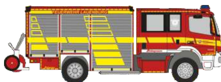
SCHLINGMANN Varus HLF 20 „FW Lauenburg“ - Formneuheit 72903 | 1:87 | D | 27,90 €