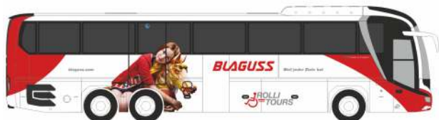
MAN Lion's Coach L `17 „Blaguss“ 74830 | 1:87 | AT | 32,90 €