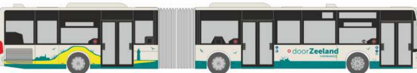
MERCEDES-BENZ Citaro G E4 „Connexion – TCR“ 69952 | 1:87 | NL | 36,90 €