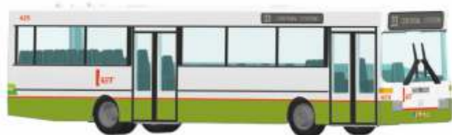
MERCEDES-BENZ O 405 „RET, Rotterdam“ 71821 | 1:87 | NL | PG 45