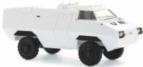
THYSSEN TM-170 „UN“ 67865 | 1:87 | D | PG 32