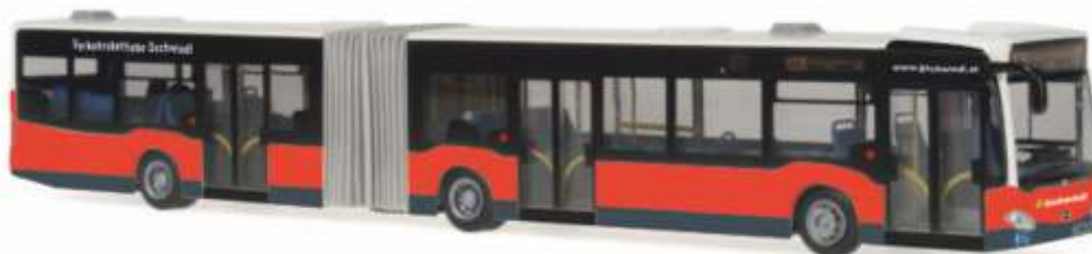
MERCEDES-BENZ Citaro G 11 „Gschwindl Reisen“ 68825 | 1:87 | A | PG 49