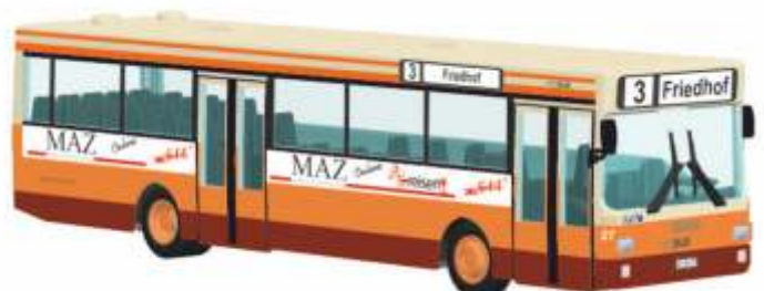
MAN SL 202 „Mit.Bus, Gießen“ 72123 | 1:87 | D | PG 45