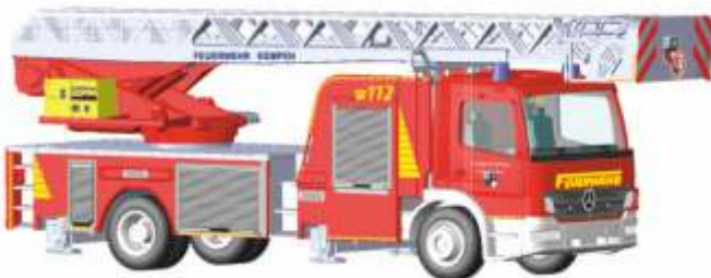
MAGIRUS DLK 32 Atego „Feuerwehr Kempen“ 71609 | 1:87 | D | PG 43