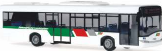
SOLARIS Urbino 12 „Steiermärkische Landesbahnen“ 65959 | 1:87 | A | PG 43