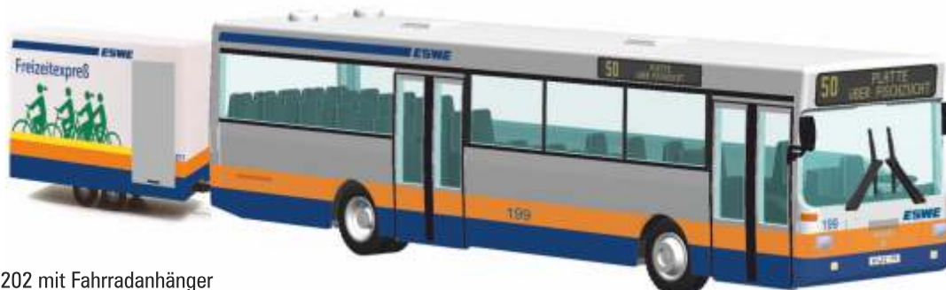
MAN SL 202 mit Fahrradanhänger „ESWE, Wiesbaden“ 72122 | 1:87 | D | PG 46