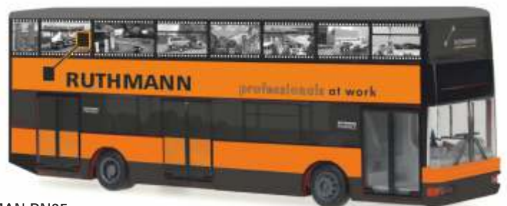
MAN DN95 „Ruthmann Service“ 67525 | 1:87 | D | PG 49