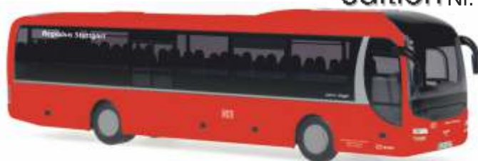
MAN Lion's Regio „Regiobus Stuttgart“ 65845 | 1:87 | D | PG 45