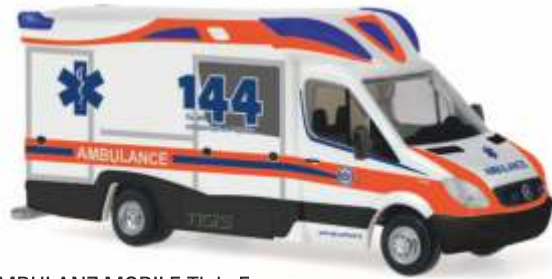
AMBULANZ MOBILE Tigis Ergo „Ambulanz St. Gallen“ 68624 | 1:87 | CH | PG 28