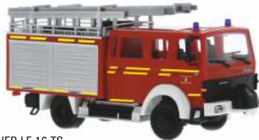
LENTNER LF 16-TS „Feuerwehr Holzkirchen“ 71212 | 1:87 | D | PG 41