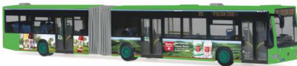
MERCEDES-BENZ Citaro G 06 „Rhön Energie Bus, Fulda“ 67081 | 1:87 | D | PG 49