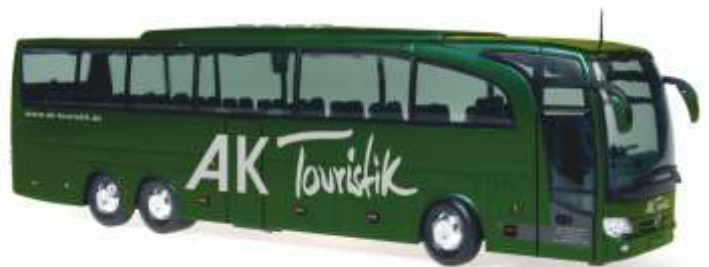
MERCEDES-BENZ Travego M „AK Touristik, Kiel“ 66350 | 1:87 | D | PG 45