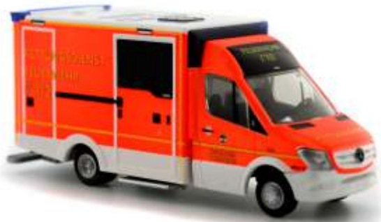
WIETMARSCHER AMBULANZFAHRZ. Design-RTW 2012 „Feuerwehr Dormagen“ 72015 | 1:87 | D | FN | PG 28