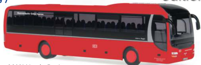
MAN Lion's Regio „Busverkehr Oder-Spree“ 65848 | 1:87 | D | PG 45