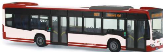
MERCEDES-BENZ Citaro `12 „Stadtwerke Krefeld“ 69468 | 1:87 | D | PG 45