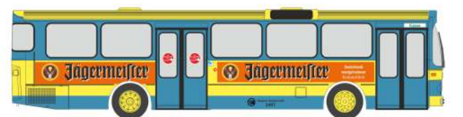
MERCEDES-BENZ O 305 „EVAG - Jägermeister“ 74300 | 1:87 | D | PG 49