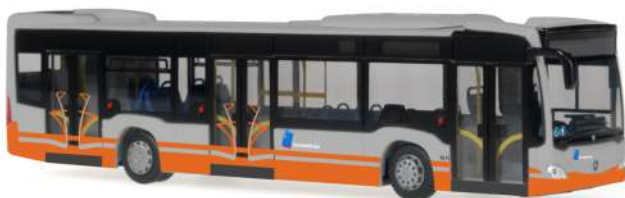
MERCEDES-BENZ Citaro `12 „STIB“ 69465 | 1:87 | B | PG 45