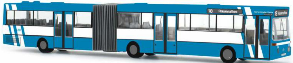
MERCEDES-BENZ O 405 G „KVG Kassel“ 69828 | 1:87 | D | PG 49