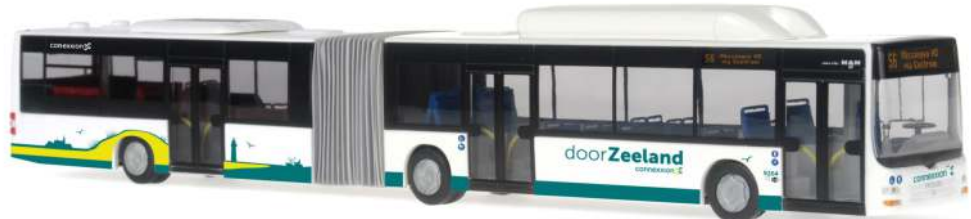
MAN Lion's City G „Connexxion Zeeland“ 72751 | 1:87 | NL | PG 49