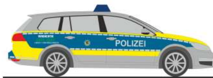
VOLKSWAGEN Golf 7 Variant „Polizei Sachsen“ 53301 | 1:87 | D | 16,90 €