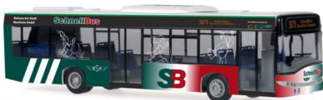
SOLARIS Urbino 12 „BSM - Schnellbus, Monheim“ 65964 | 1:87 | D | PG 45