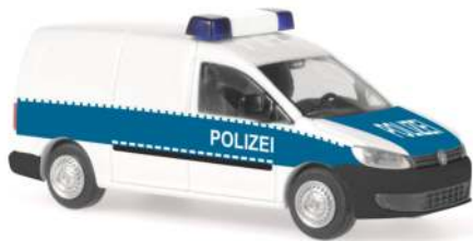
VOLKSWAGEN Caddy Maxi `11 „Polizei“ 52707 | 1:87 | D | PG 23