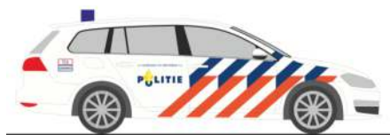
VOLKSWAGEN Golf 7 Variant „Politie“ 53302 | 1:87 | NL | 16,90 €