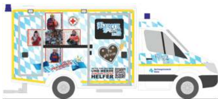
WIETMARSCHER AMBULANZ RTW „Rettungstechnik Klein“ 61748 | 1:87 | D | 20,90 €