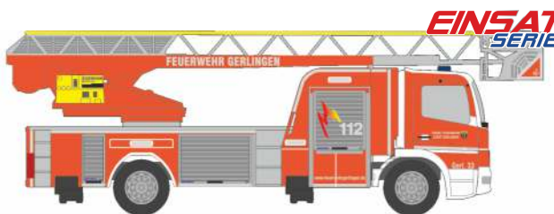
MAGIRUS DLK 32 „Feuerwehr Gerlingen“ 71614 | 1:87 | D | PG 49