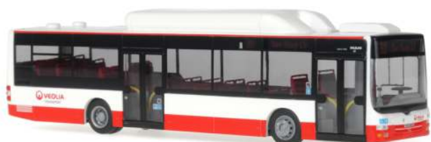
MAN Lion´s City „Veolia“ 72704 | 1:87 | NL | PG 45