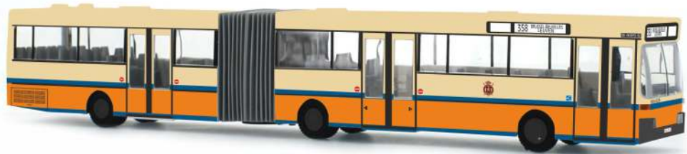
MERCEDES-BENZ O 405 G „NMVB“ 69818 | 1:87 | NL | PG 49