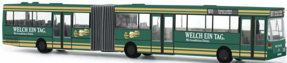
MERCEDES-BENZ O 405 G „NIAG - Diebels“ 69827 | 1:87 | D | PG 50