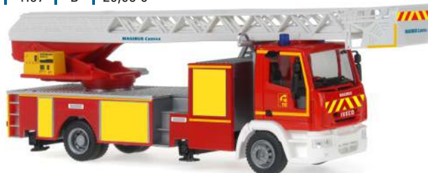
IVECO MAGIRUS DLK 32 „Fw18“ 68550 | 1:87 | F | PG 45