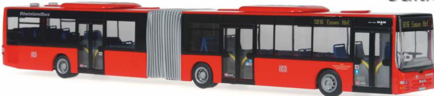
MAN Lion's City G „Rheinlandbus - Düsseldorf“ 67277 | 1:87 | BV | LIMIT500 | 12/2013 | PG 49