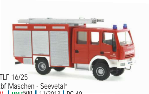
IVECO-MAGIRUS TLF 16/25 „Deutsche Bahn Rbf Maschen - Seevetal“ 68113 | 1:87 | BV | LIMIT500 | 11/2013 | PG 40