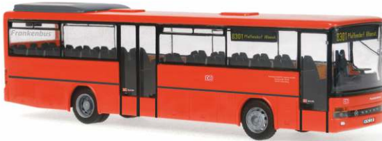
SETRA S 315 UL „Frankenbus - Nürnberg“ 61348 | 1:87 | BV | LIMIT500 | 10/2013 | PG 37