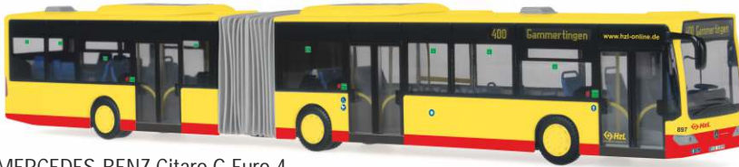
MERCEDES-BENZ Citaro G Euro 4 „HzL Hohenzollerische Landesbahn AG -Hechingen“ 67066 | 1:87 | BV | LIMIT500 | 09/2013 | PG 47**